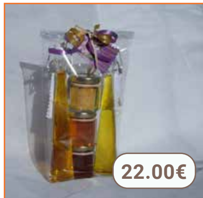
Sachet cadeau découverte du SAFRAN (sirop 4cl, vinaigre de chasselas 4cl, caramel pommes miel 55g, fleur de sel de Guérande 30g) SAFRAN DU TERROIR TARNAIS