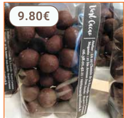
Ballotin chocolats assortis 250g - Ingrédients issus de l'agriculture BIO VERT CACAO