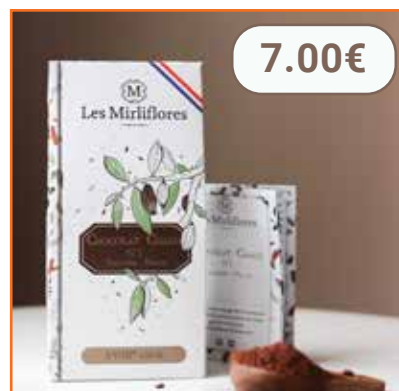
Préparation pour chocolat chaud 80g LES MIRLIFLORES