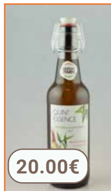
Quintessence de gingembre 50cl JCE