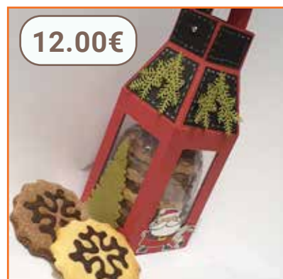
Lanterne de Noël avec Choc'occitan 210g LA PETITE BISCUITERIE