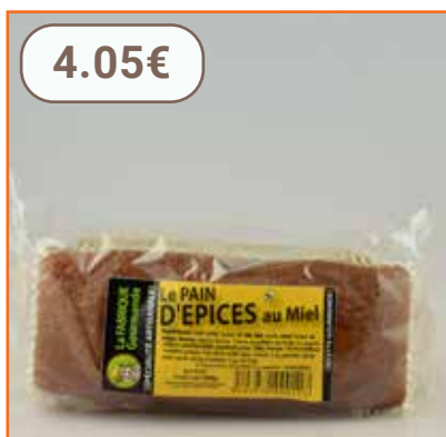
Pain d'épices au miel 300g BISCUITERIE SAVOUR MIEL