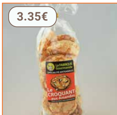
Croquants aux amandes 100g BISCUITERIE SAVOUR MIEL