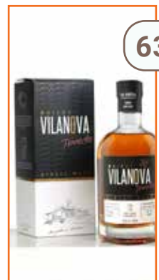
Berbie Whisky 35cl DISTILLERIE CASTAN