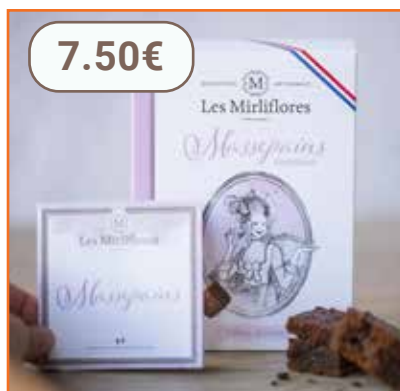
Massepains au chocolat 200g LES MIRLIFLORES