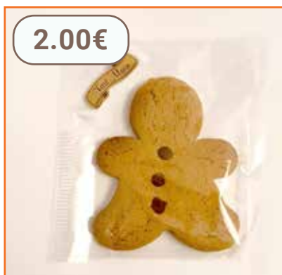
Bonhomme de pain d'épices 24g LA PETITE BISCUITERIE