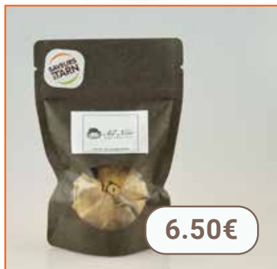
Ail noir tarnais 40/50g EP LES GOURMANDS