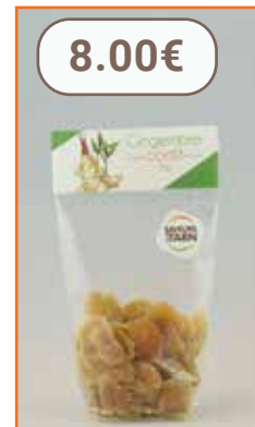
Gingembre confit 100g JCE